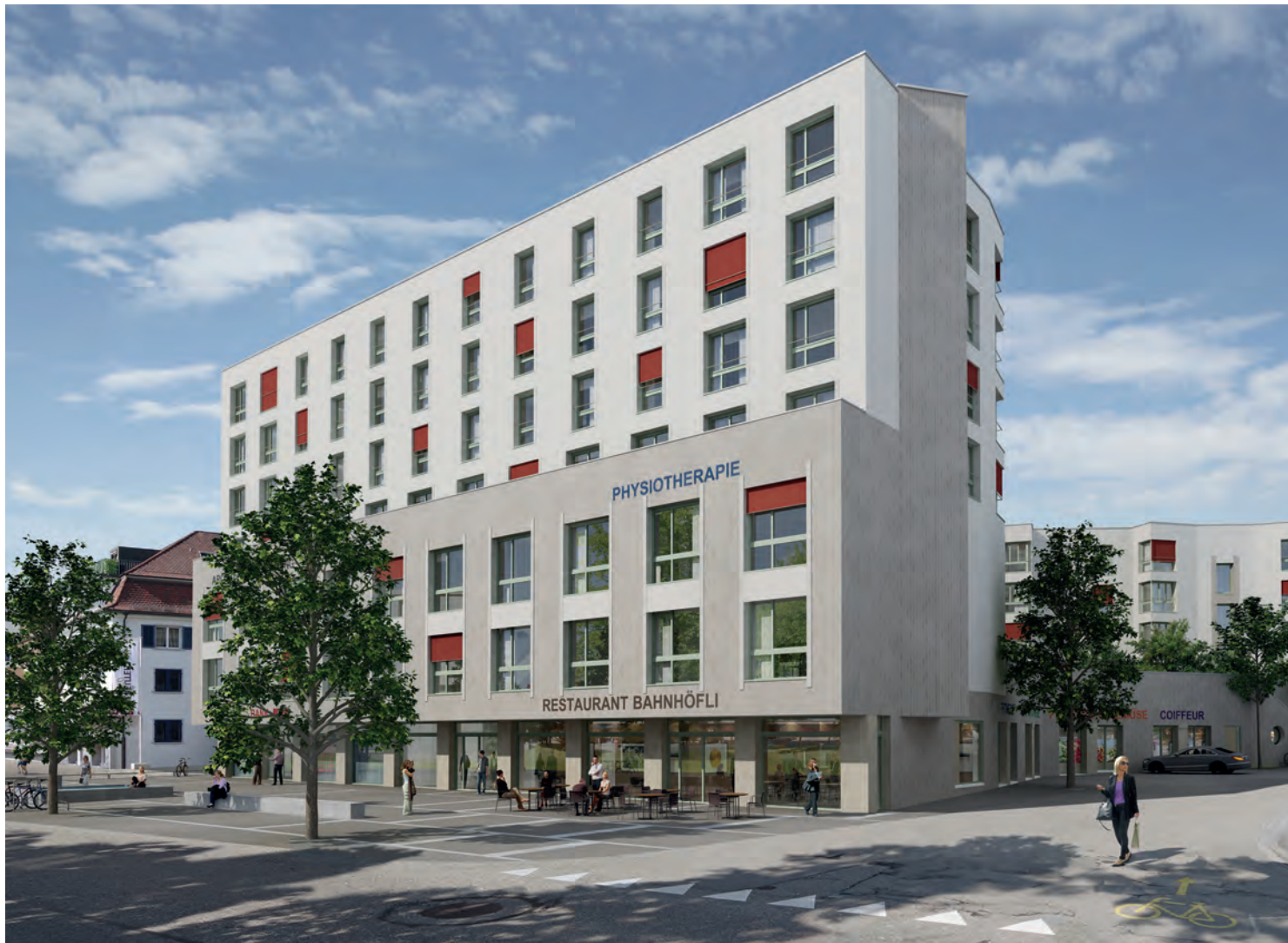
Ansicht der künftigen «Bellis»-Überbauung vom Bahnhof Effretikon aus betrachtet.