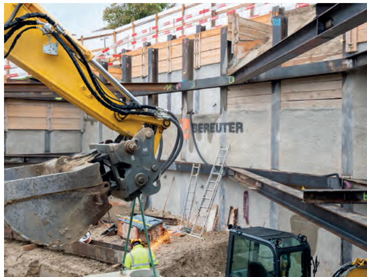
Der Bagger dient nicht nur für den groben Aushub, sondern auch für die millimetergenaue Justierung der Stahlträger.

Werubau AG, die im Vorhaben als Bauherrin sowie als GU auftritt, nennt das Projekt «La Collina» - der Hügel.