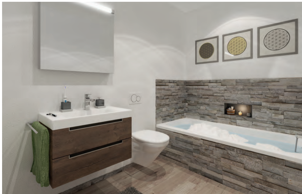
Mit dem Wohnungsangebot wird von Singles über Familien bis hin zu Senioren eine breite Zielgruppe angesprochen.

weitere Gewerbeflächen erstellt. Im Sommer 2020 wurde der entsprechende Gestaltungsplan genehmigt.